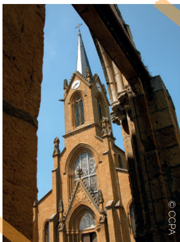
Eglise de Savigny

Rejoignez le rond-point par les sens interdit et remontez la rue de la Rivière puis prenez la rue Pierre Bost à droite et la deuxième à droite route de Sain Bel pour rejoindre le parking de la Mairie.