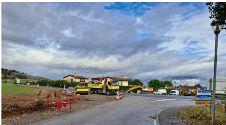
Travaux du giratoire en cours

Les travaux ont débuté le 2 octobre et devraient se terminer fin novembre sauf aléas. Cet investissement permettra d'apaiser et de sécuriser la circulation sur ce carrefour pour l'ensemble des utilisateurs, automobilistes, cyclistes ou piétons (notamment au niveau de l'arrêt de bus qui se trouve sur la zone).