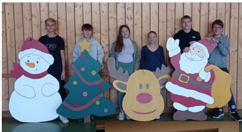
Chantier jeunes d'octobre 2023