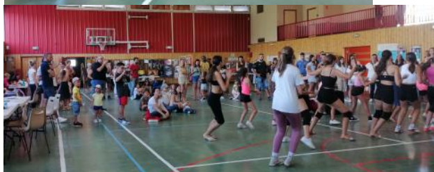
Démonstration de Savigny Danse au forum des associations