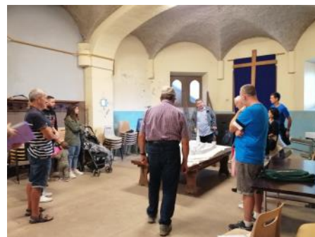
Visite commentée du village pour les nouveaux arrivants

Le prochain chantier de la commission communication sera de travailler sur la refonte du site internet, afin d'avoir une présentation plus dynamique, et surtout un format plus adapté aux portables ou tablettes. Merci aux personnes qui ont répondu au sondage sur Illiwap sur l'utilisation du site internet.