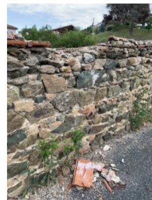
Mur du chalet Montange avant (ci-dessus) - après (ci-dessous)

D'ici la fin de l'année, quelques travaux d'aménagement vont être faits par la société Dubost Recorbet au 2ème étage au-dessus de la médiathèque, afin d'accueillir l'association peinture qui est à l'étroit dans le local qu'ils utilisent actuellement. L'espace libéré (au 1 er étage) sera réaménagé en salle de réunion.