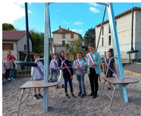
Inauguration de la tyrolienne